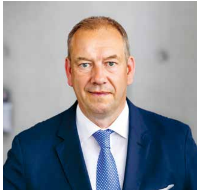
Ihr Henning Otte, Wehrbeauftragter des Deutschen Bundestages

„OB IM GRUNDBETRIEB, IN PERSÖNLICHEN KRISEN ODER IM EINSATZ: SEELSORGE IST EIN ANGEBOT, DAS VERTRAUEN SCHAFFT UND HALT GIBT.“