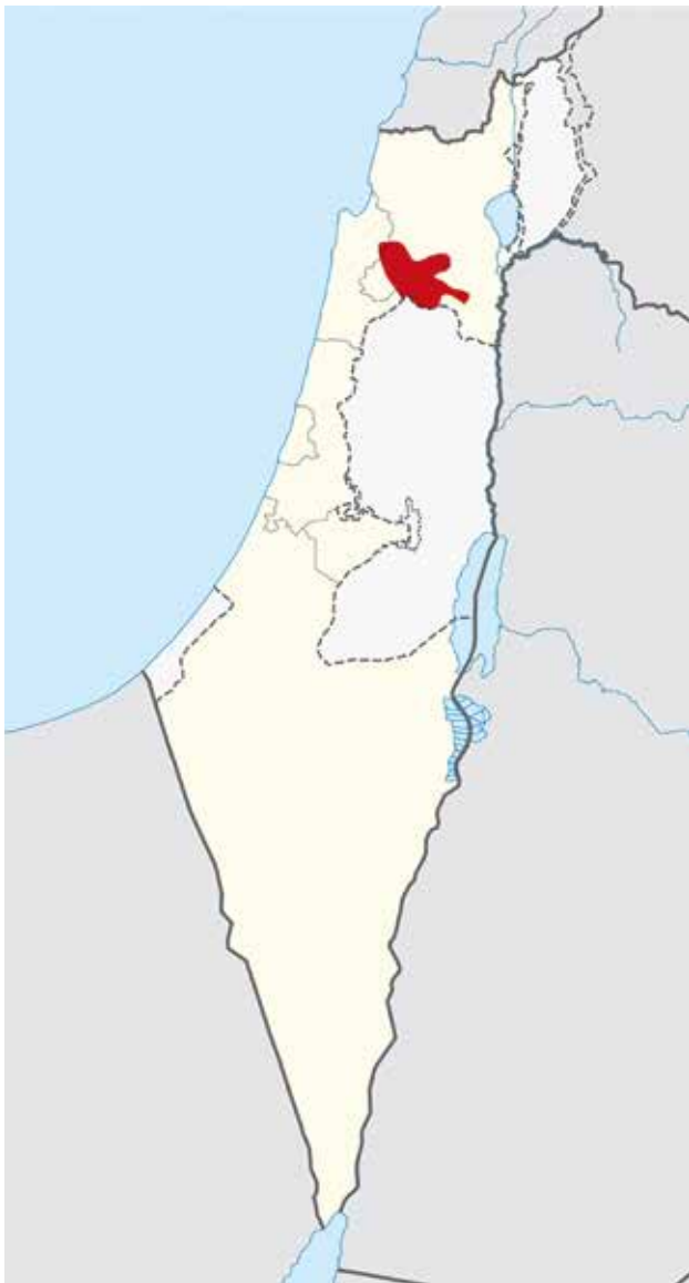
Ebene Jesreel leicht gefunden 😊

Ja, so etwas gibt es; freilich in der Geschichte, näherhin in der biblischen Geschichte, um aber ganz genau zu sein im Alten Testament. Diese Präzisierung ist schon allein deswegen notwendig, damit Preußenfans, allen voran die von Friedrich dem Großen, nicht sofort an die Schlacht von Leuthen vom 5. Dezember 1757 am Beginn des Siebenjährigen Krieges gegen die zahlenmäßige Übermacht der Österreicher denken.