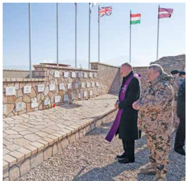
Gebet für die gefallenen Soldaten am Ehrenhain in Mazar-e Sharif.