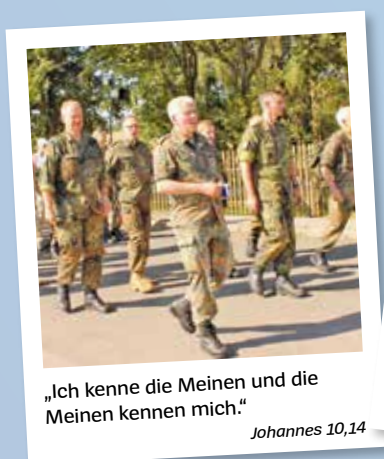
„Ich kenne die Meinen und die Meinen kennen mich.“