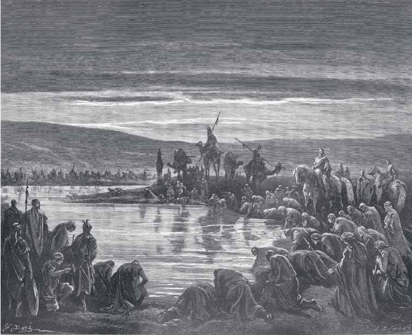
Sieghafte Männer schlürfen wie die Hunde.